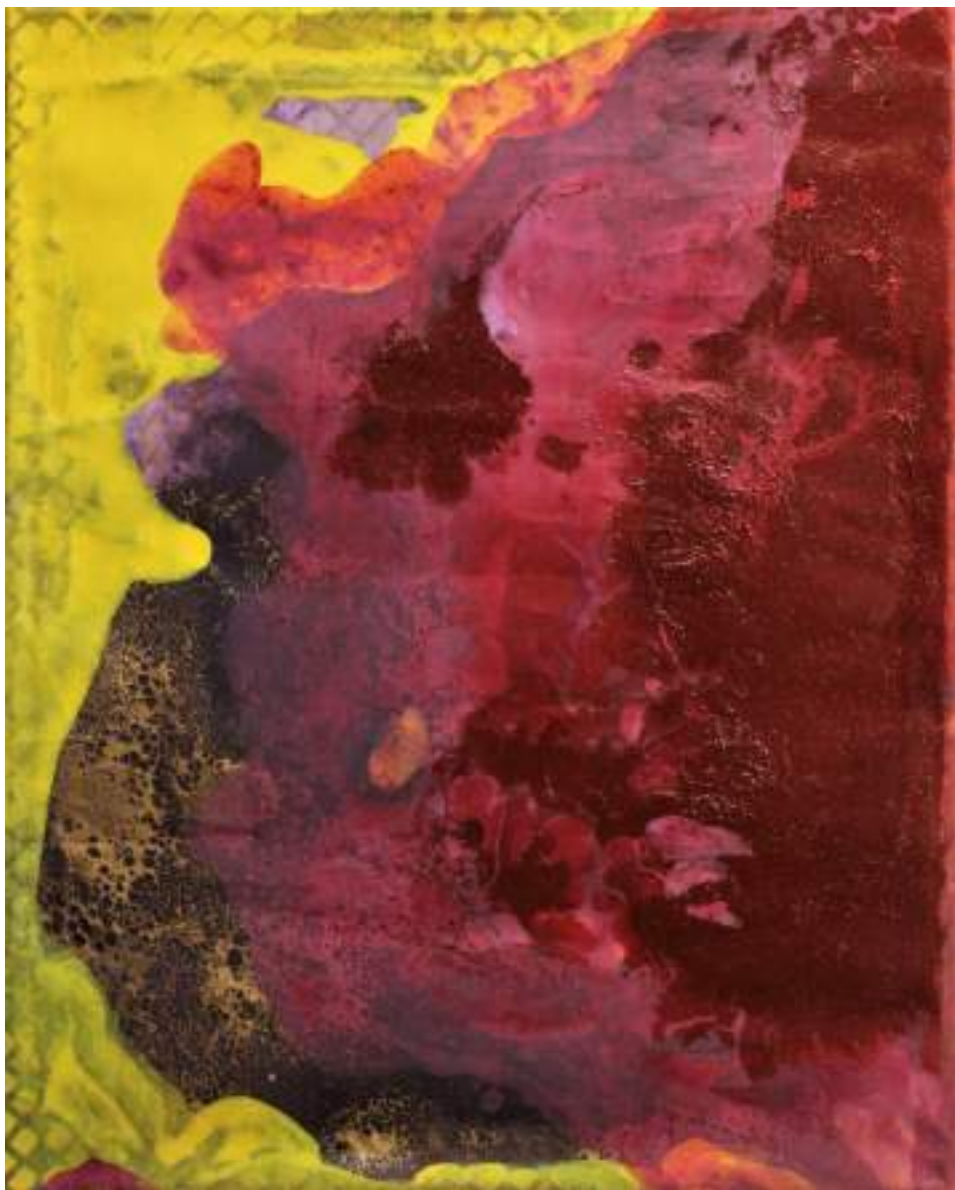
Fiori del mare T.M. su tela, 35x27cm, 2021