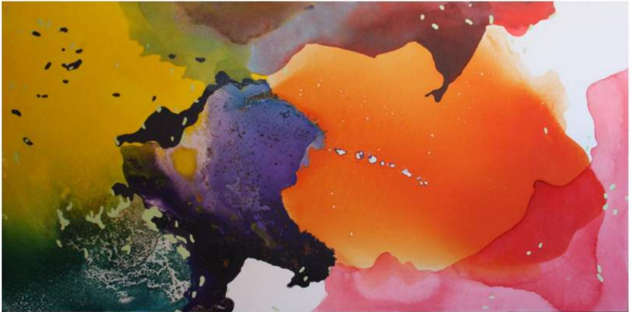
Sotto la superficie Acrilico e olio su tela, 140x70cm, 2020