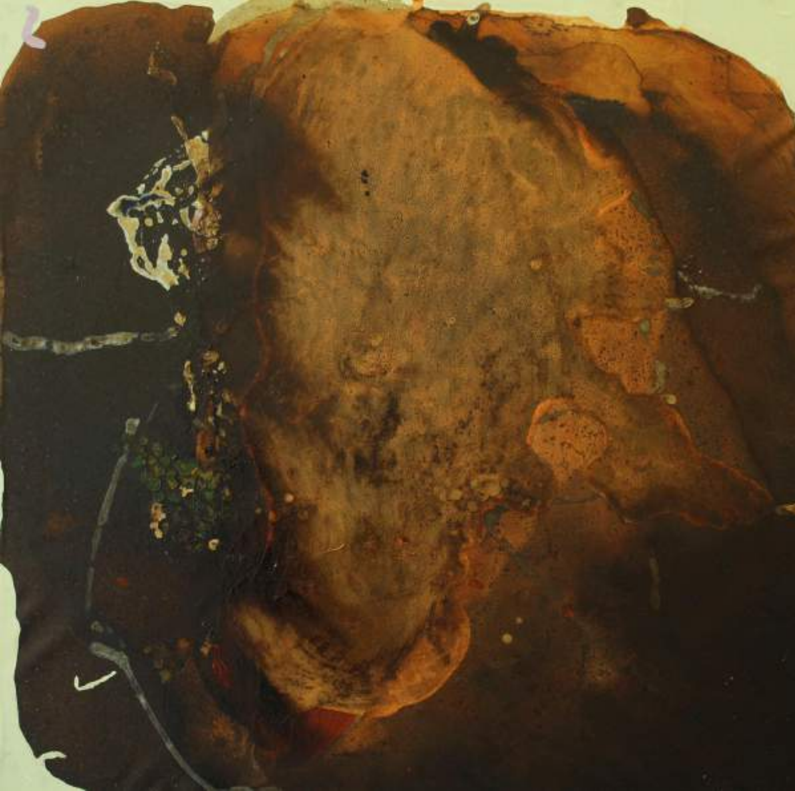
Per fortuna le tartarughe mangiano le spugne Olio, acrilico e bitume su tela, 70x70cm, 2019