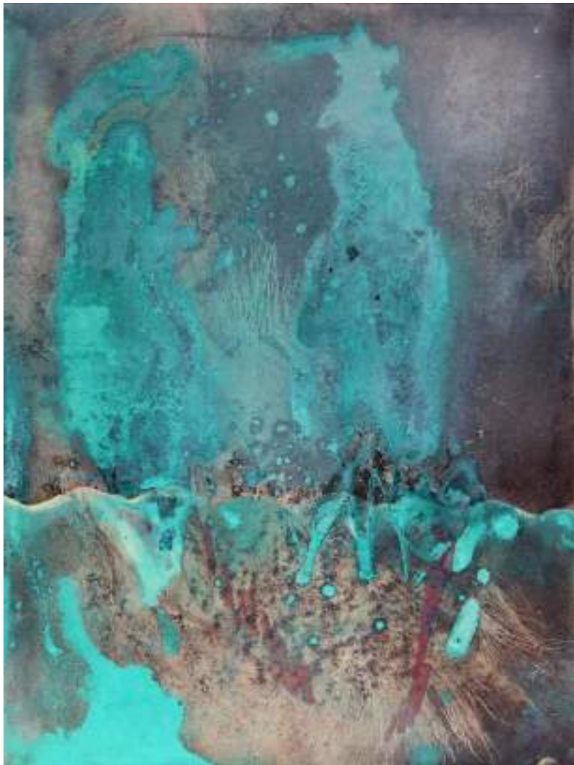
Sopra la superficie T.M. su lino, 40X30cm, 2020