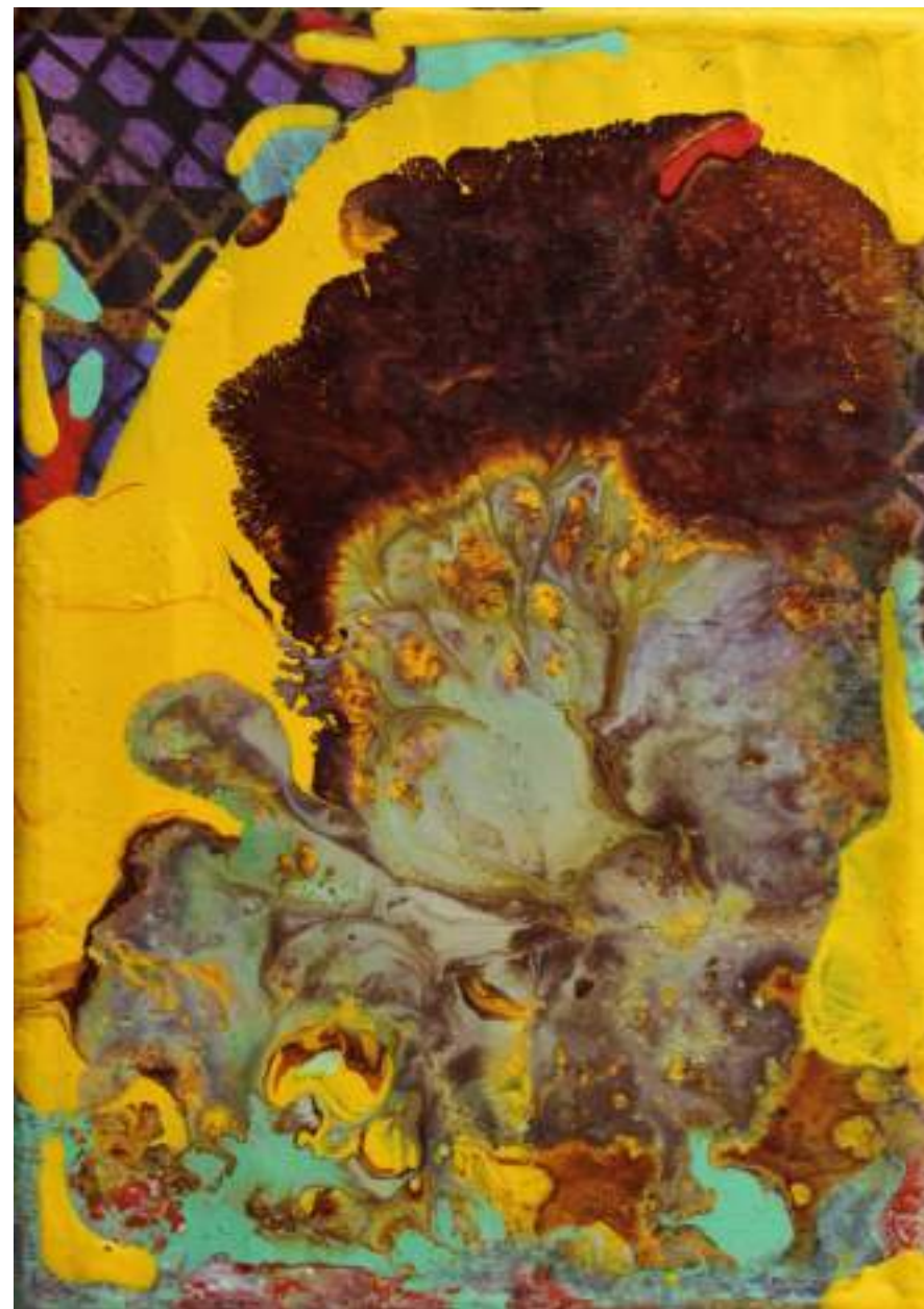
Fiori del mare Acrilico su tela, 21x14cm, 2020