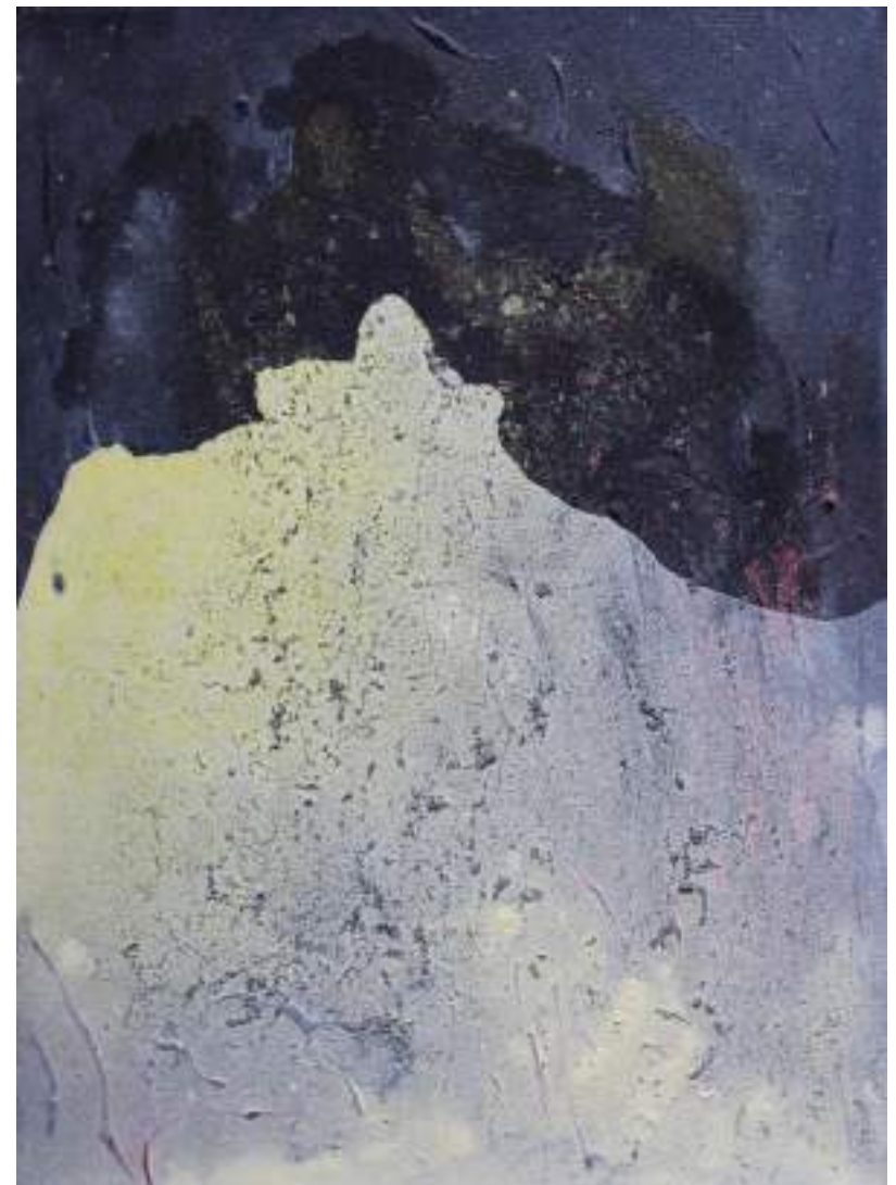
Sotto la superficie T.M. su juta, 40x30cm, 2020