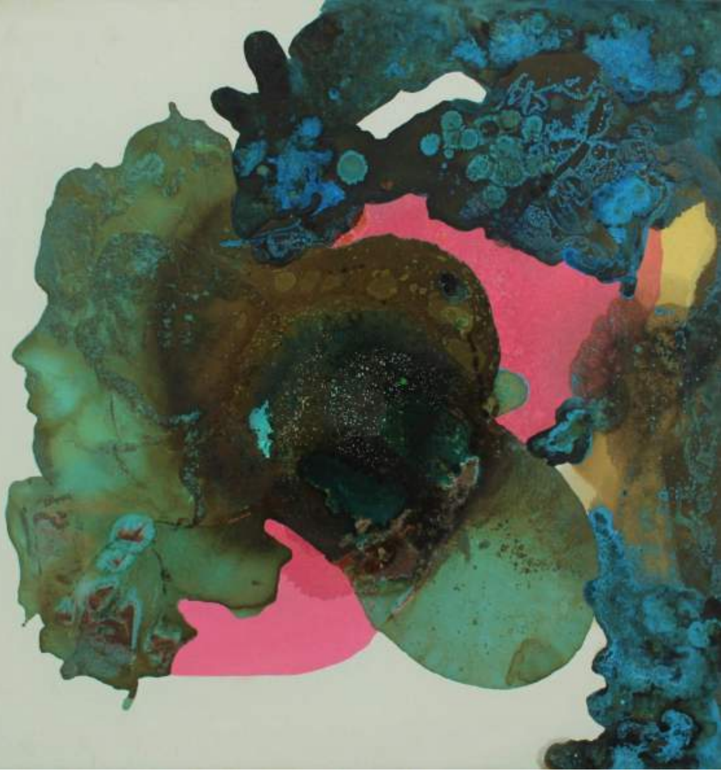
Quando un polipo esplode Olio, acrilico e bitume su tela, 100x100cm, 2019