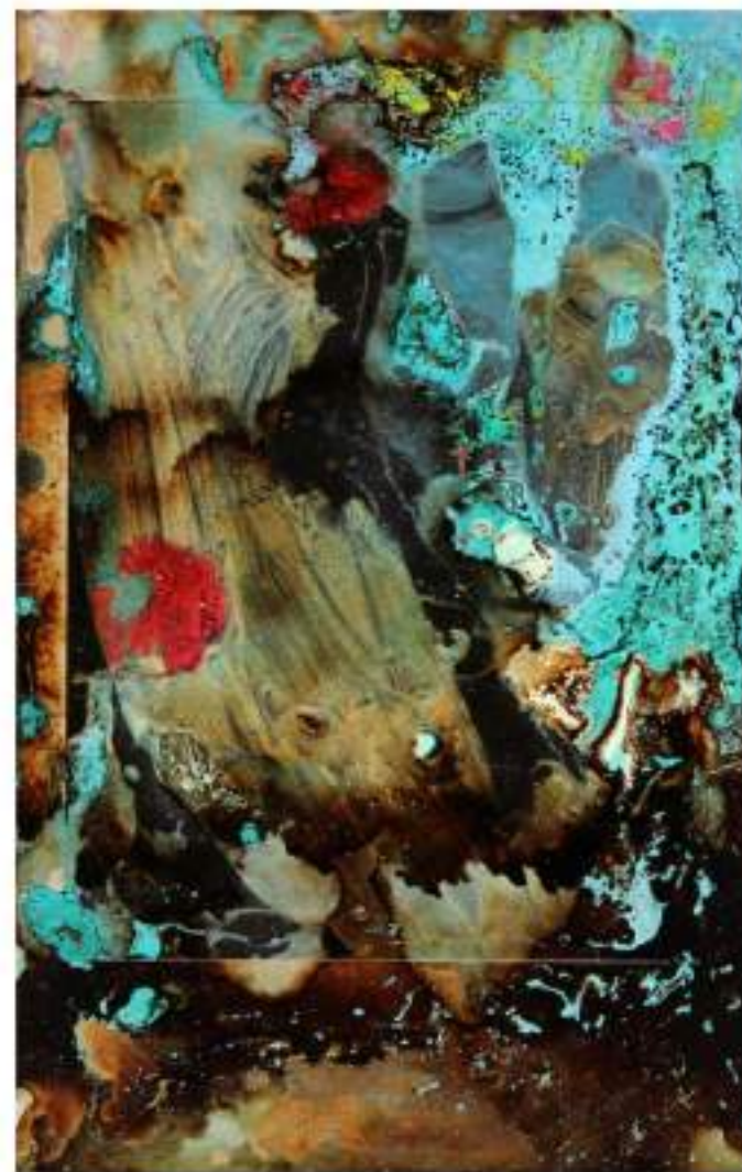
Polaroid bruciate T.M. su carta fotografica, 9x5cm cad., 2020