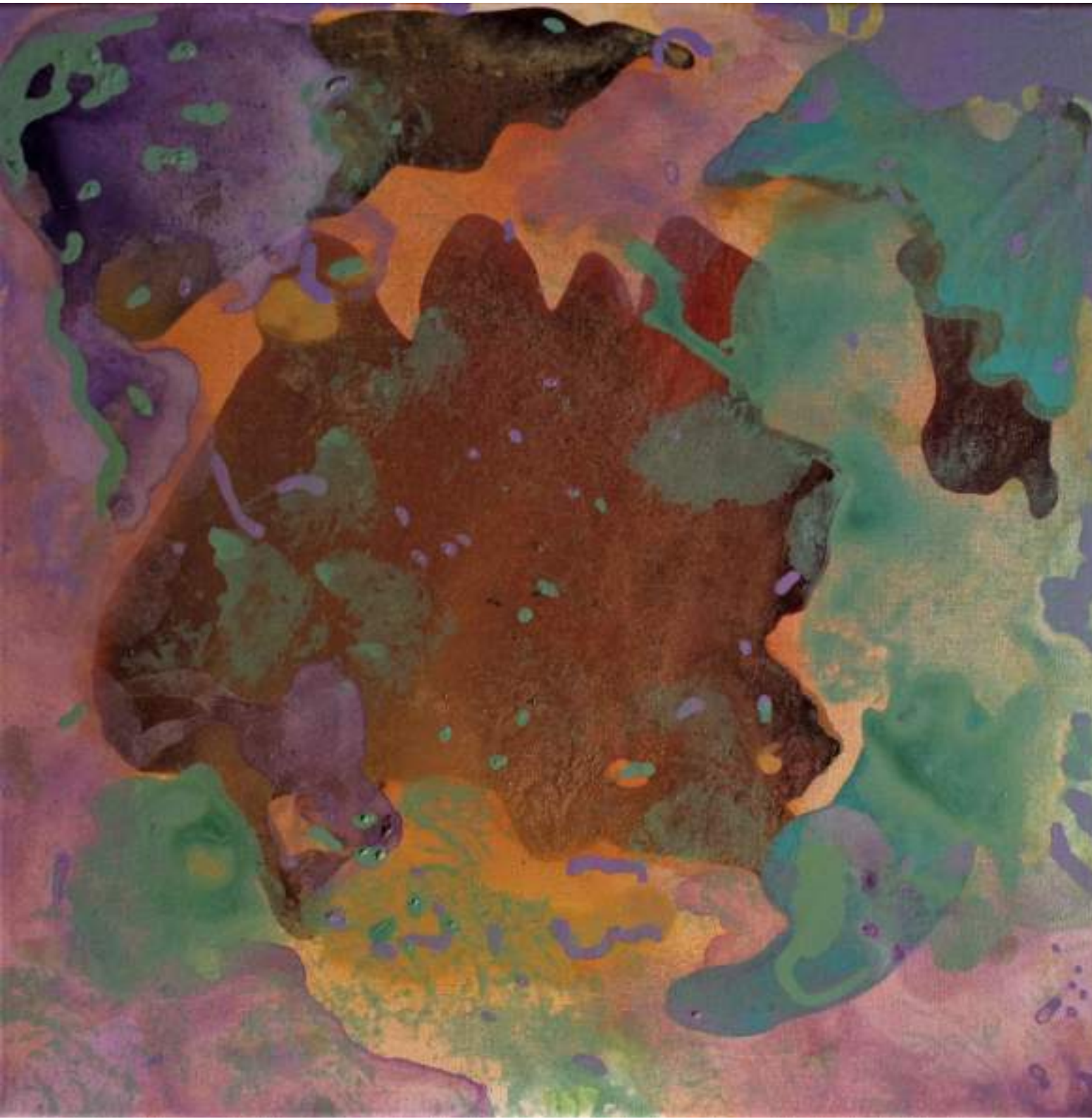
Reef Acrilico e smalto su tela, 50x50cm, 2020