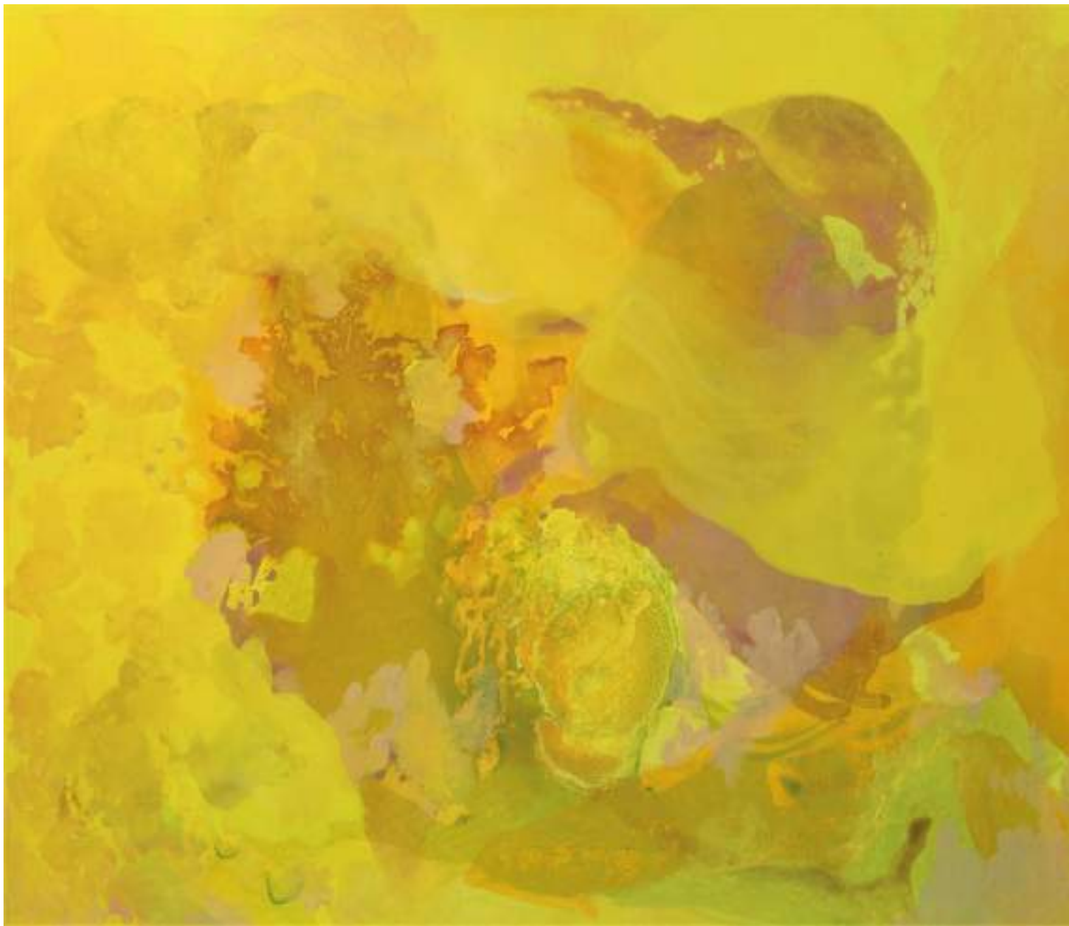
Sotto gli ulivi Acrilico su tela, 60x70cm, 2021