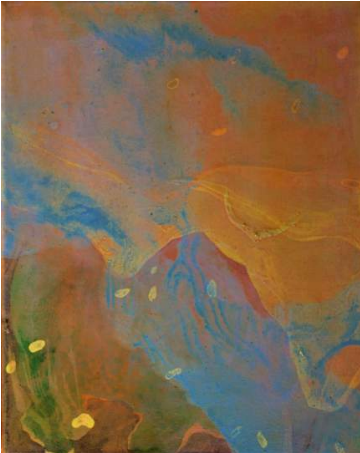
Fiume Acrilico su tela, 35x27cm, 2021